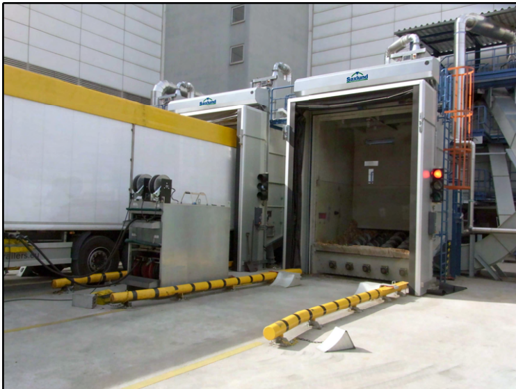
Andocken des LKW-Trailers mit Hilfe von Lichtschrankengesteuerten Ampelsignalen

Optional kann die TDS mit einem Hydraulikaggregat geliefert werden, um den Walking Floor des LKW-Anhängers mit Hydraulikdruck zu versorgen.