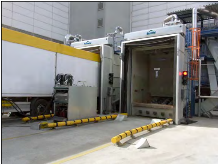
Andocken des LKW-Trailers mit Hilfe von Lichtschrankengesteuerten Ampelsignalen

Optional kann die TDS mit einem Hydraulikaggregat geliefert werden, um den Walking Floor des LKW-Anhängers mit Hydraulikdruck zu versorgen.